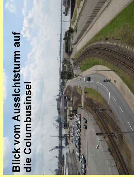
Blick vom Aussichtsturm auf die Columbusinsel